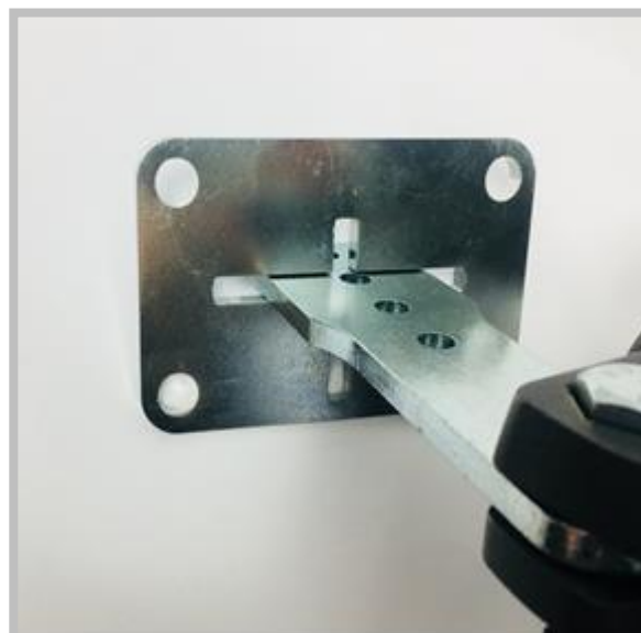
Sposób montażu blachy na szerokim słupku