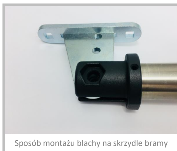
Sposób montażu blachy na skrzydle bramy

Blachę uniwersalną należy przyspawać od tyłu razem z uchwytem od siłownika. Spoinę należy zabezpieczyć przed korozją np. alucynkiem lub farbą antykorozyjną.