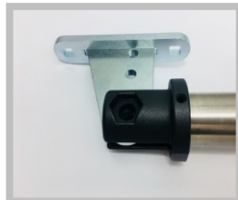
Montaż blachy na skrzydle bramy