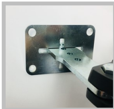
Montaż blachy na szerokim słupku