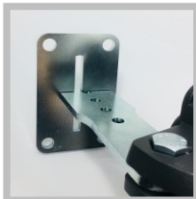
Montaż blachy na wąskim słupku